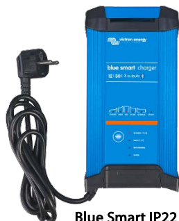
Blue Smart IP22 12/30 (3)