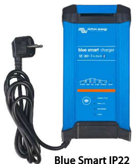
Blue Smart IP22 12/30 (3)