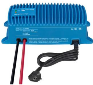
Blue Smart IP67-laddare 12/25