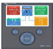
Color Control GX