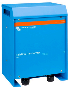
Isolation Transformer 3600W