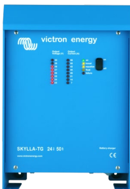
Skylla TG 24 50