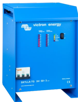
Skylla TG 24 50 3-fas

För att lära dig mer om batterier och batteriladdning, läs gärna vår bok "Energy Unlimited" (Obegränsad Energi) som kan laddas ner från www.victronenergy.com .