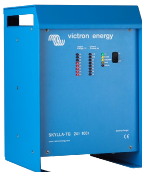
Skylla TG 24 100