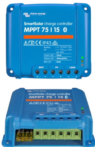
SmartSolar laddningsregulator MPPT 75/15