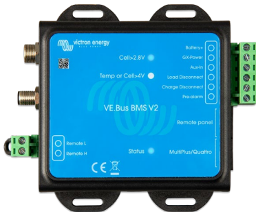
VE.Bus BMS V2